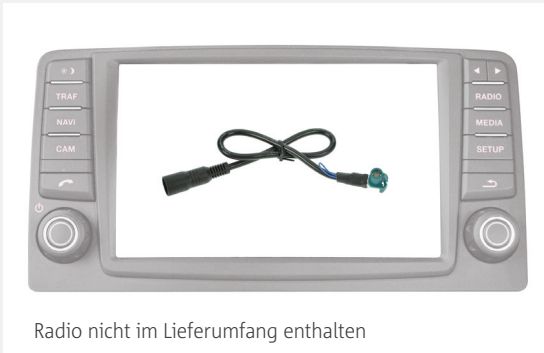
Radio nicht im Lieferumfang enthalten

Plug & Play Adaptionen an MAN MMT Systeme zum Anschluss von AXION Kameras