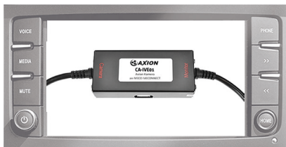
Radio nicht im Lieferumfang enthalten

Kameraanbindung an das IVECO IVECONNECT Navigationsradio